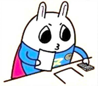
東京地方税理士会 イメージキャラクターの「トッチーくん」

令和7年1月24日(金) 会場:宮前区役所 令和7年1月31日(金) 会場:中原区役所